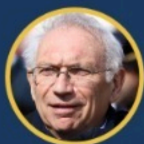
Patrizio Bianchi Ministro dell'Istruzione