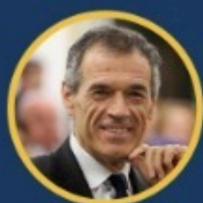
Carlo Cottarelli Direttore Osservatorio sui Conti Pubblici Italiani