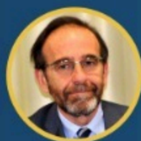
Riccardo Nencini Presidente Commissione Istruzione Senato della Repubblica