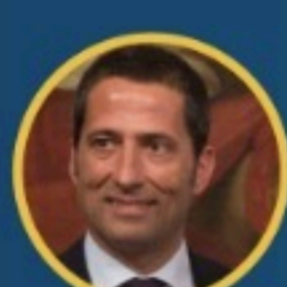
Gianluca Vacca Componente Commissione Cultura Camera dei Deputati