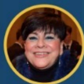
Valentina Aprea Componente Commissione Cultura Camera dei Deputati